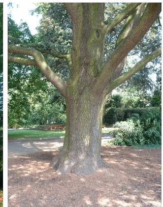
, 21 Août 2003