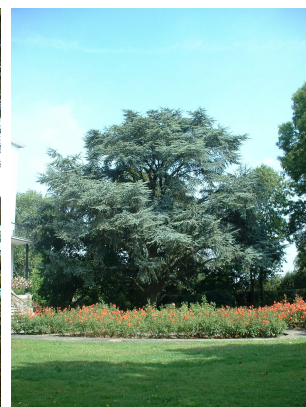
, 21 Août 2003