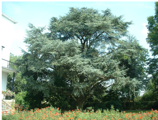
, 21 Août 2003