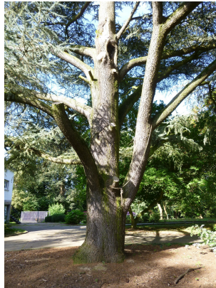
, 08 Octobre 2013