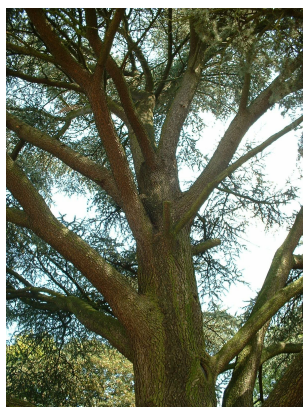
, 21 Août 2003