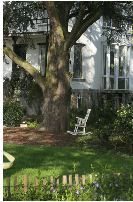
, 27 Avril 2023