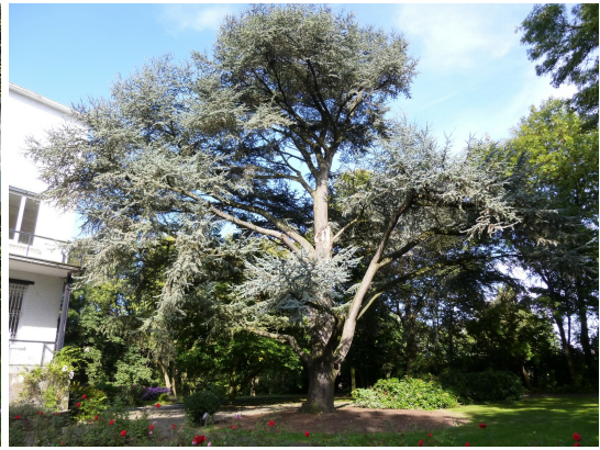
, 08 Octobre 2013